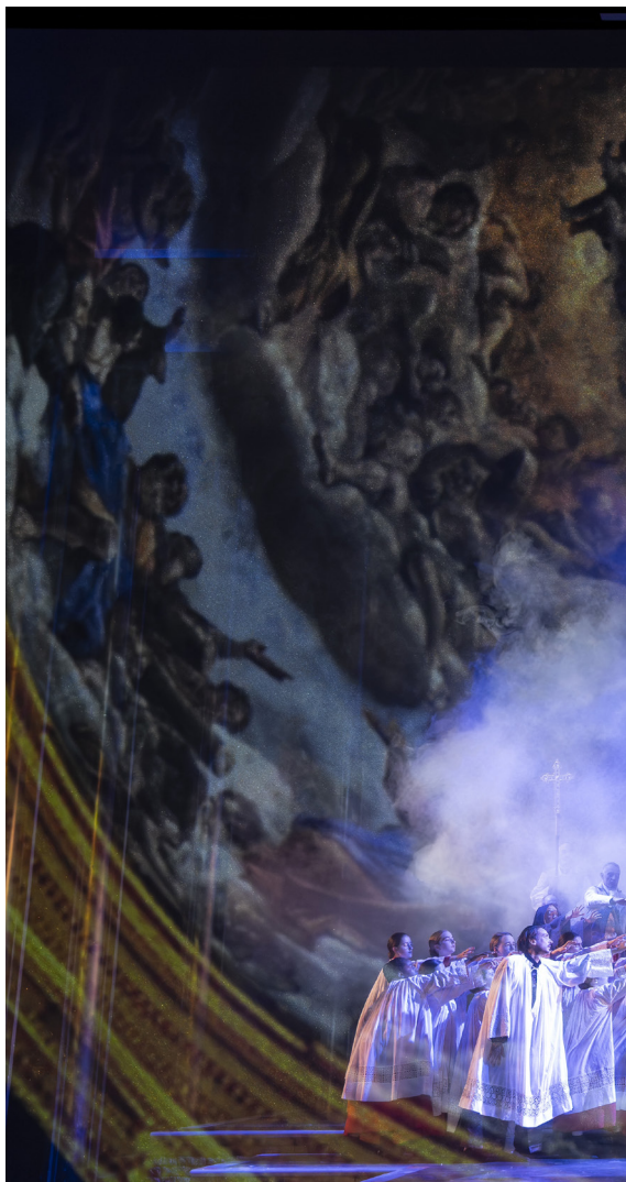
© Cyrille Cauvet - Opéra de Saint-Étienne

Au lever du jour, Mario chante une dernière fois son amour pour Tosca qui arrive sur ces entrefaites. Elle réussit à l'informer qu'elle a tué Scarpia, que l'exécution sera feinte et qu'ils pourront quitter Rome grâce au sauf-conduit qu'elle a réussi à obtenir. Mario fait face au peloton d'exécution et meurt. Les hommes de Scarpia courent vers Tosca pour l'arrêter, mais elle se jette alors dans le vide.