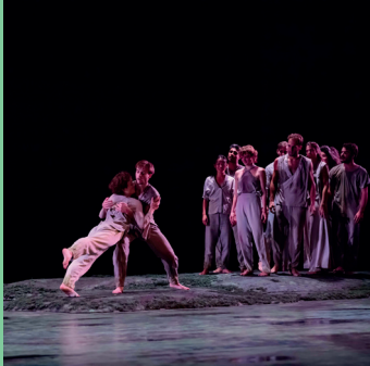
Les Nuits d'été