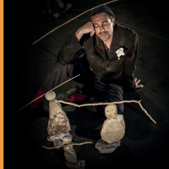
Les Petits Touts