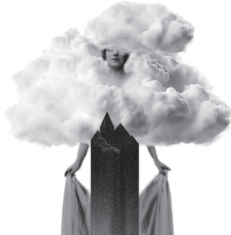
Le Château des Carpathes