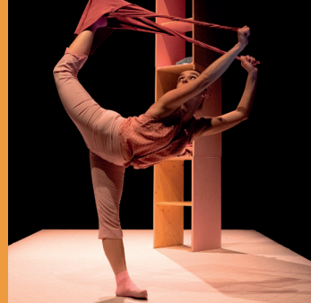
Dans la boucle