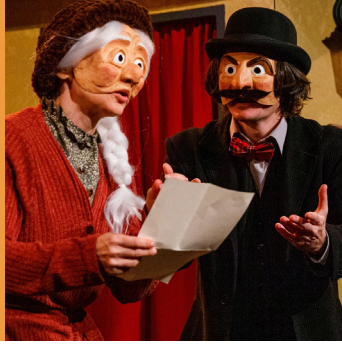
Le secret des arbres